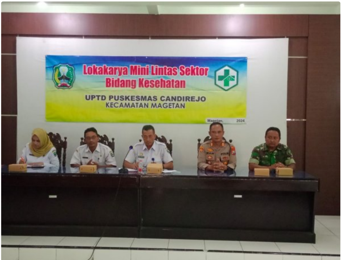
Bati TUUD Koramil 0804/01 Magetan Hadiri Loka Karya Mini Lintas Sektor Tri Bulanan Bidang Kesehatan

MAGETAN. - Bati TUUD Koramil Tipe B 0804/01 Magetan Kodim Magetan Pelda